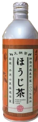
リシール缶ほうじ茶465g

今年、春期に向けてリシール缶リニューアルをいたします。リニューアルに伴いケース記載表示に「一括表示」「栄養成分表示」を追加いたします。